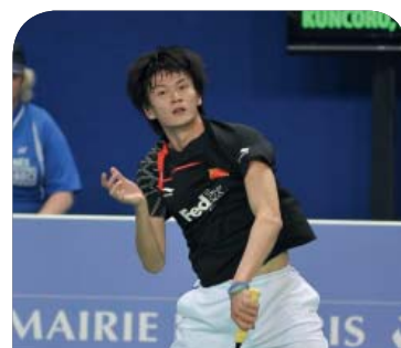
Gaucher 17/02/1983 15

Vainqueur ici même l'an passé pour le plus grand bonheur du public parisien, Peter Gade vit une belle histoire d'amour avec les Internationaux de France. Il avait songé à arrêter sa carrière fin 2007 mais sa défaite contre Bao Chunlai au stade des demi-finales de l'édition 2007 l'a motivé pour continuer. Il avait déclaré à l'époque qu'il jouerait encore au moins une année ne serait-ce que pour revenir à Paris. Très bon choix puisqu'il remporte les IFB en 2008 devant une foule en délire et gagne le SuperSeries de Corée en janvier. Il y domine le n°1 mondial Lee Chong Wei en finale ! Peter s'attend à un gros match aujourd'hui face à un joueur qui l'a déjà battu cette année « Chunlai se rapproche du niveau de Lin Dan, il est très fort, je devrai être au top demain pour m'imposer ».