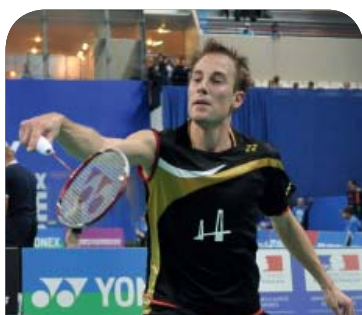
Droitier 14/12/1976 9