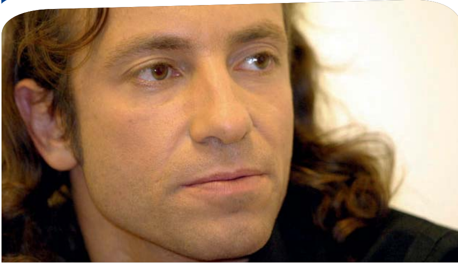
Philippe Candeloro Patinage artistique, commentateur sportif

“ Le badminton ? Tout le monde croit y avoir joué. Mais, c'était du volant et cela se passait au camping ou à la plage. C'était en famille, en loisirs... Là, on s'embête vite. Il ne se passe pas grand chose et si vos parents ne vous ont pas acheté une quinzaine de volants, vous êtes bons pour arrêter toutes les cinq minutes pour aller chercher votre volant dans un arbre. C'est un peu