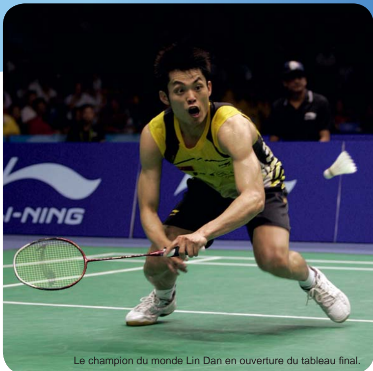
Le champion du monde Lin Dan en ouverture du tableau final.