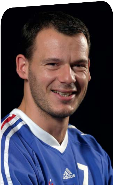
Guéric Kervadec Ex-international de handball, champion du monde en 1995

“ Je ne suis pas un adepte forcené. Mais je l'ai utilisé le badminton dans ma préparation pour travailler les